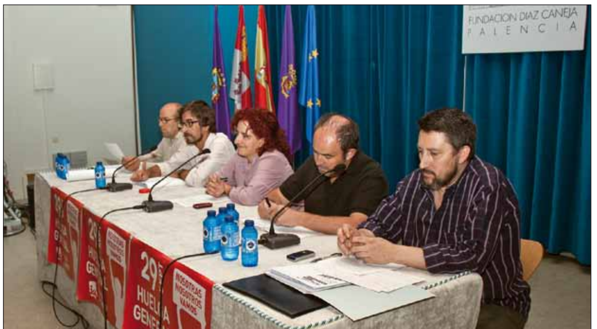
Representantes de los sindicatos en la Mesa Redonda convocada por I.U. sobre la Reforma Laboral

La estrategia es muy clara: socialicemos las pérdidas (para los de abajo) y privaticemos las ganancias (para los de arriba) . Que el Estado, o sea todos y todas, se quede con aquello que es deficitario que las grandes empresas se repartirán el pastel. El problema es que cuanto más cogen algunos, menos nos queda a los demás. Y SÓLO HAY UN PASTEL.