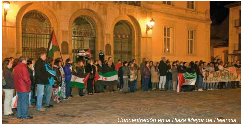
Concentración en la Plaza Mayor de Palencia