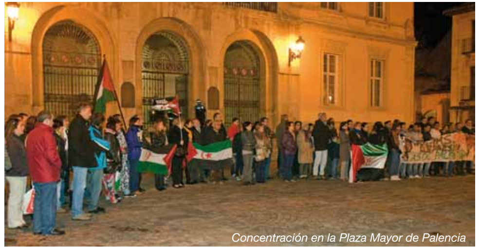
Concentración en la Plaza Mayor de Palencia